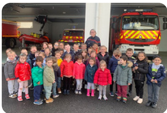
Visite de la caserne des pompiers de Decize

Toutes ces actions et ces manifestations ne pourraient pas voir le jour sans l'aide financière de l'Association Sportive et Culturelle de l'école, de La Tirelire des Ptits Léos ou encore de la Municipalité. Qu'ils en soient tous remerciés très sincèrement.